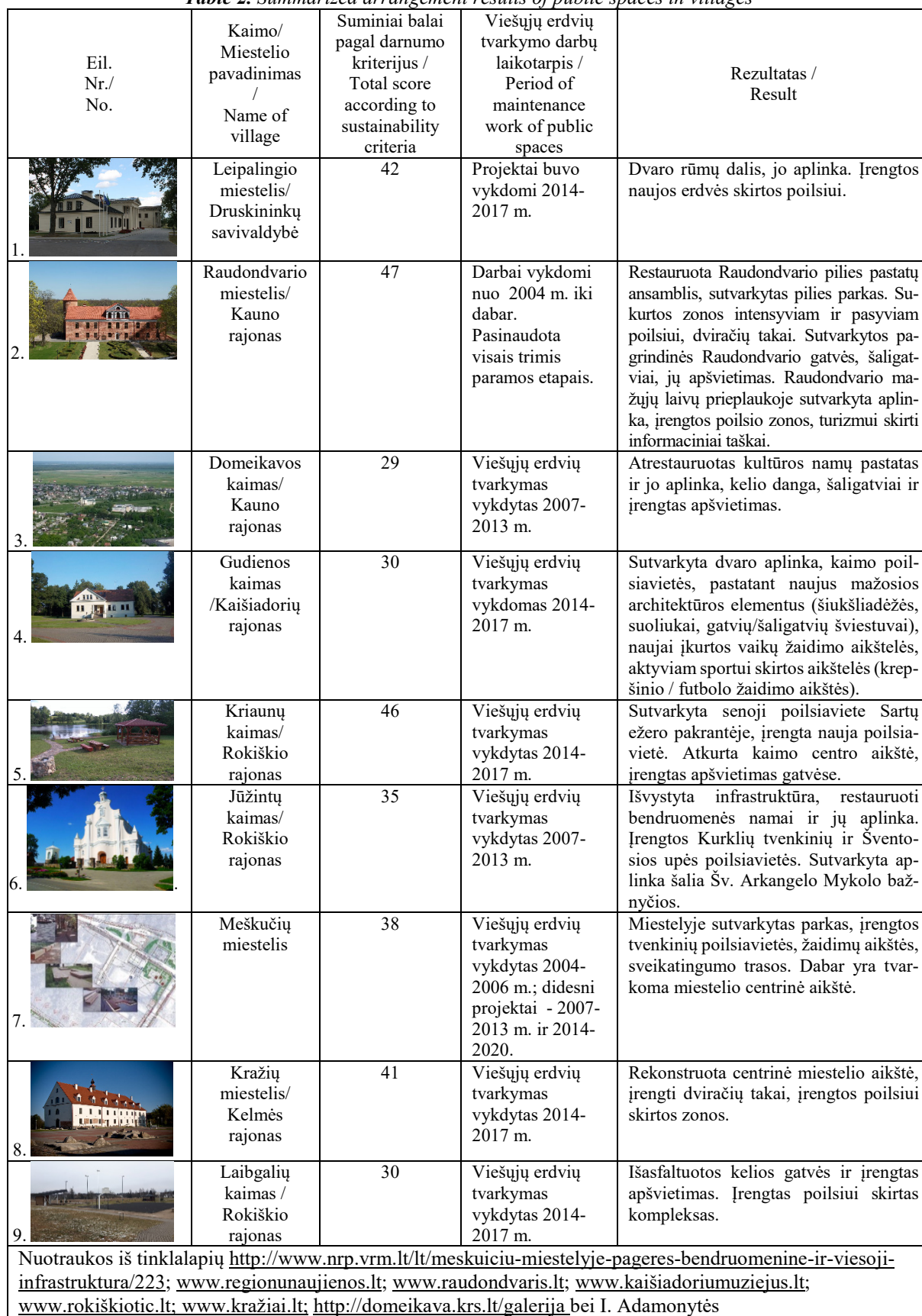
2 lentelė. Miestelių viešųjų erdvių tvarkymo apibendrinti rezultatai Table 2. Summarized arrangement results of public spaces in villages