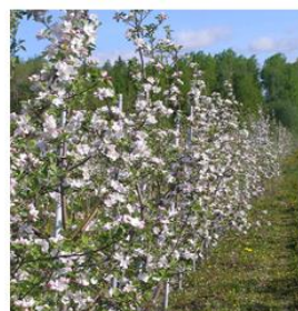
2 pav. Veislės ‘Orlovskoje polosatoje’ vaisiai ir vaismedžiai

Obelys sode buvo pasodintos 2022 metų pavasarį, poskiepis M.26, sodinimo schema 1,25 x 3,5 m (2 286 vaism. / ha).